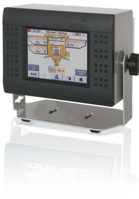
P205 с VOLUnet SC

motan принцип смешивания при падении обеспечивает идеальное смешивание компонентов еще до экструдера и вносит тем самым важный вклад в оптимальную пластификацию и гомогенизацию смеси материала.