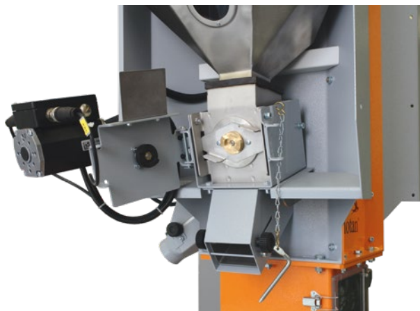
Прецизионный дозирующий шнек с подшипником с одной стороны и с байонетным замком