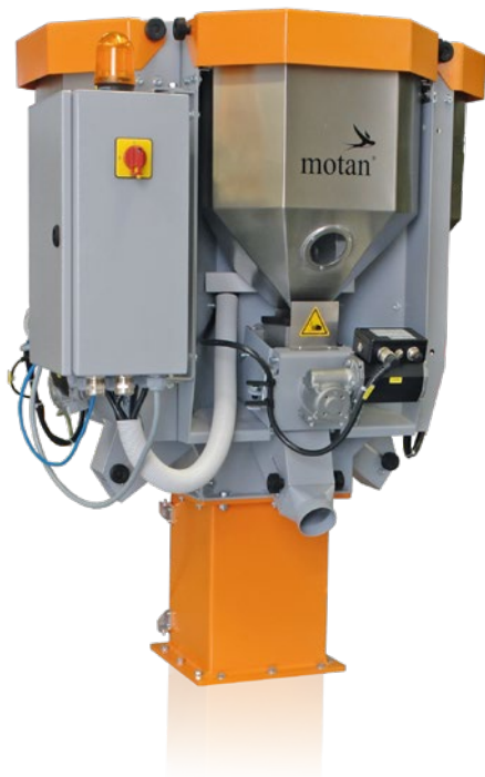
SPECTROCOLOR V с 10 литровым накопительным бункером и с трех модулей дозирования